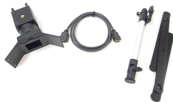
(左から) スコープカメラ本体、専用ケーブル、専用スタンド