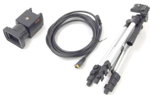
(左から) CCD カメラ本体、専用ケーブル、三脚