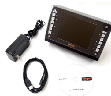
(上段左から) AC アダプター、マルチスイッチャー、 USB ケーブル、ドライバー CD-ROM